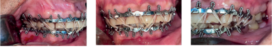
Imagen 2. Se puede observar oclusión dental en máxima intercuspitación durante la cirugía.

acceder a segmentos óseos no comprometidos como ángulo y rama mandibular derecha y abordaje submandibular izquierdo a nivel de parasífnis mandibular izquierda. Cabe mencionar que hubo orificio de entrada y salida de la bala, cada herida de aproximadamente 1 cm, fue lavada y debridada al ingresar al centro hospitalario.